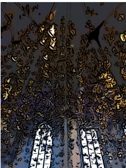
güllene Duwen-Swake van unnen