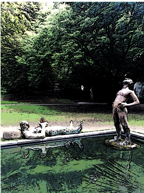
Sketch For a Fountain [Skizze für einen Brunnen] (c) Gaffeltange

De Steeg is aower nich dat einzig interessante Projekt. An de Kreuzschanze steiht en Springbrunnen van Nicole Eisenberg. Se schapt en Kontrast to de traditionelle Springbrunnen, as man se vun grote Marktplätz kennt. Staats vörnehme of praislike Figuren, de enen Springbrunnen normalerwiese utmaken, sitten of liggen an düsse Brunnen Figuren de äer mööd un fardig utsaihen.