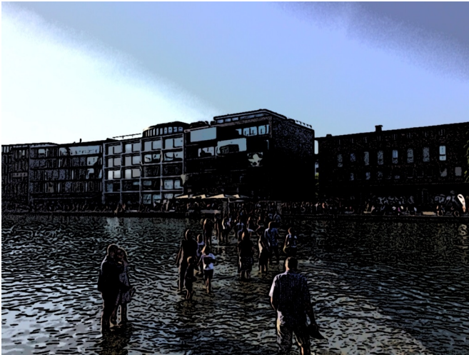
On Water [Auf dem Wasser]

De Steeg is aower nich dat einzig interessante Projekt. An de Kreuzschanze steiht en Springbrunnen van Nicole Eisenberg. Se schapt en Kontrast to de traditionelle Springbrunnen, as man se vun grote Marktplätz kennt. Staats vörnehme of praislike Figuren, de enen Springbrunnen normalerwiese utmaken, sitten of liggen an düsse Brunnen Figuren de äer mööd un fardig utsaihen.