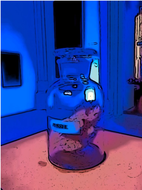
Myrrhe un Weihrauch in'n Kiärkeningang