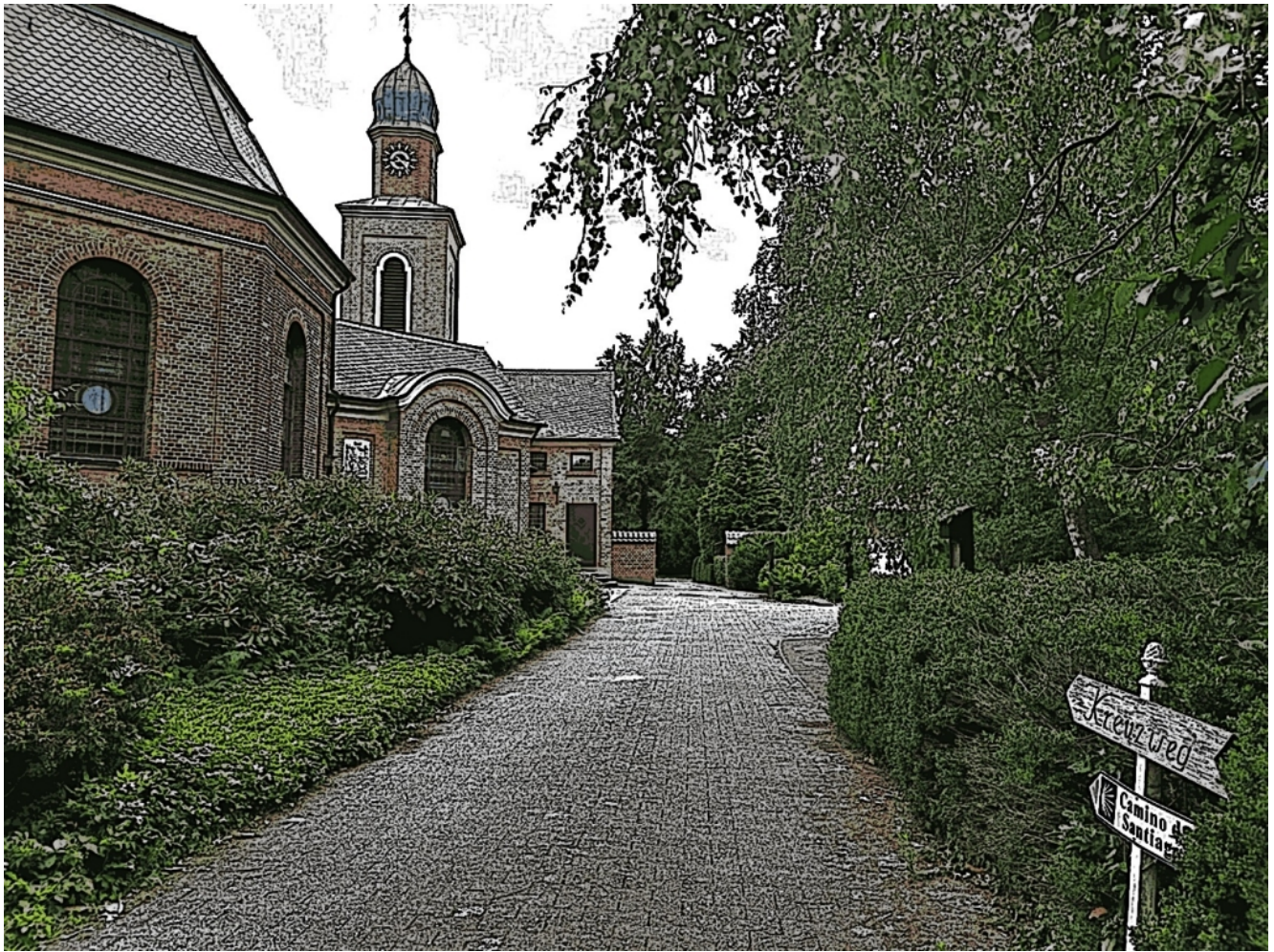
De Jakubswech in Münster. Hümmlinger Pilgerwech

Een masse lütkeren Wech is de Hümmlinger Pilgerwech. De Hümmling is een Region in Osten von den Landkries Emsland in Niedersachsen. De Gegend is präget dör masse Buerei, Feller und masse Heide. Ook bünd dor nich masse Berge wat et einfach för een Pilgerschaft moaket. De Wech haf fieft Ettapen de eenzeln of nananner lopen wern könnt. De Wech wat bedrieven von een eegenen Verien un jährluch güfft et ook organiseerde Pilgertouren, woar man de Nacht in de Bildungsstätte Clemenswerth verbrocht. De Bildungsstätte is unnerbrocht in een oldet barocket Jagdschloss. Dorbi kann man de Ruhe up sück wirken laten un vिलlechte uuk n Schwenker tou de Hühnengräver moaken.