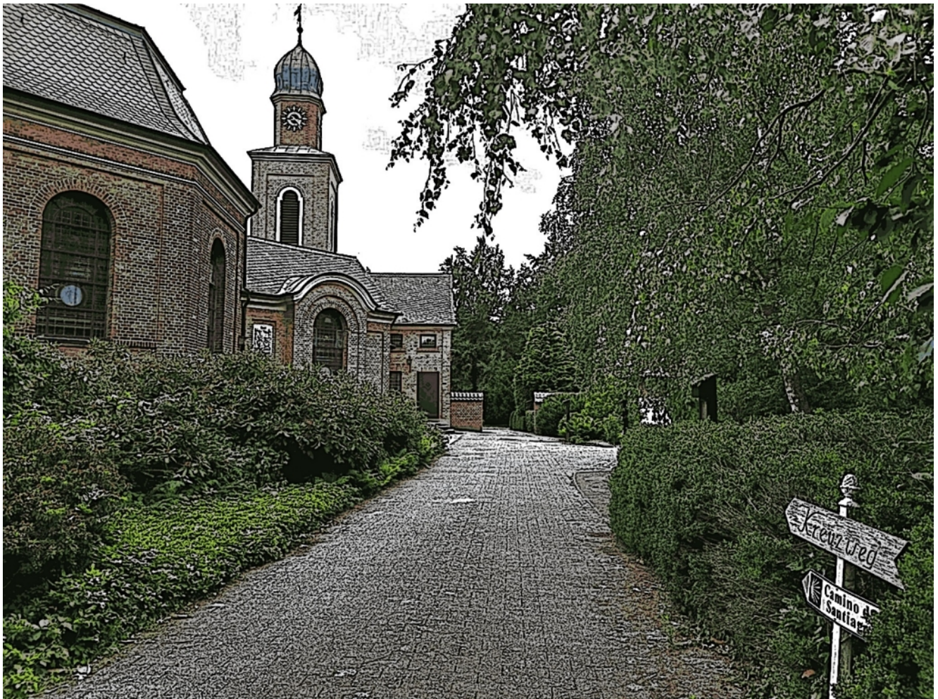
De Jakobswech in Münster. Hümmlinger Pilgerwech

wat wider utbaut und gewünn an Bedüding dadör, dat Jakobus as denn Schutzheiligen von de Region un as Schlachthelfer seen wat. Sit de 1970iger Joar pilgerten ümmer mehr Lüe denn Wech. Besünners sit Papst Johannes Paul II. süwes den Wech gaan is. Een tomünnest skurrilen Effekt ha dat Book „ich bin dann mal weg“ von den Entertainer Hape Kerkeling. 2007 – een Joar na dat erschienen- weern binoh 60 % mehr Dütsche up den Pilgerwech. In Dütschland wat de Jakobswech erst sit 1992 utwieset. Doabi güfft et verschiedene Wege. Insgesamt is de Jakobswech nich eene bestimmte Straate de na Santiago de Cpostela föhrt, sonnern een Netz. Et geef uk den Spruch: „El camino comienza en su casa“ (De Wech fängt in jaue Huus an.) De dütsche Jakobswech haff över 30 Strecken, de man gahn kann.