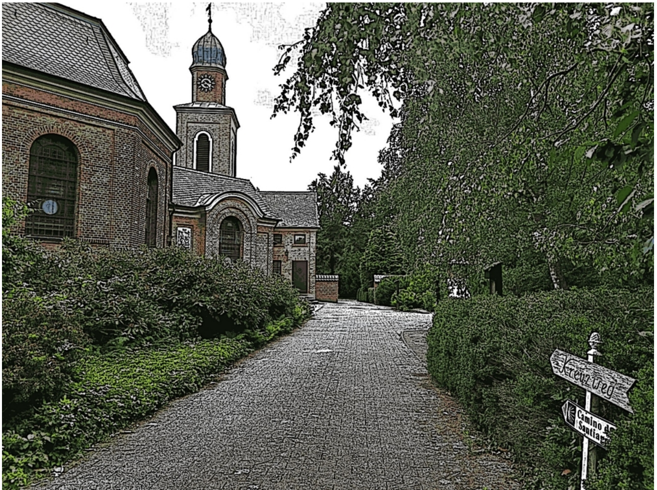
De Jakobswech in Münster. Hümlinger Pilgerwech

wat wider utbaut und gewünn an Bedüüdung dadör, dat Jakobus as denn Schutzheiligen von de Region un as Schlachthelfer seen wat. Sit de 1970iger Joar pilgerten ümmer mehr Lüe denn Wech. Besünners sit Papst Johannes Paul II. süwes den Wech gaan is. Een tomünnest skurrilen Effekt ha dat Book „ich bin dann mal weg“ von den Entertainer Hape Kerkeling. 2007 – een Joar na dat erschienen- weern binoh 60 % mehr Dütsche up den Pilgerwech. In Dütschland wat de Jakobswech erst sit 1992 utwieset. Doabi güfft et verschiedene Wege. Insgesamt is de Jakobswech nich eene bestimmte Straate de na Santiago de Cpostela föhrt, sonnern een Netz. Et geef uk den Spruch: „El camino comienza en su casa“ (De Wech fängt in jaue Huus an.) De dütsche Jakobswech haff över 30 Strecken, de man gahn kann.